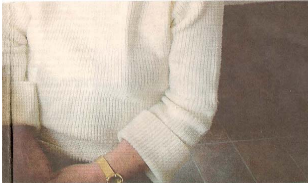
e Jorna – bogstavelig talt brikkerne til Danmarks ultimative fodboldfest på Nya Ullevi, hvor Danmark som bekendt vandt EM-

var videre under pres. Det synes jeg er slående og vældig positivt.»