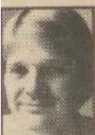
Af STEEN UNO

En højesteretsdom fra sidste år, der godkender anvendelse af anonyme vidner i danske retssale, har vakt bestyrtelse blandt jurister på alle trin i det hjemlige retshierarki. Dommen, som faldt i en københavnsk narkosag, er blevet indbragt for Den europæiske Menneskerettighedskommission.